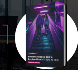
Libro físico accionable

No es un libro. No es una plataforma. Son tus clases enamorando a tu alumnado.