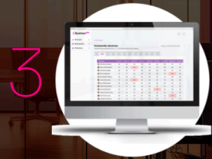
Aula virtual y cuaderno docente intuitivo

¿Quieres probar gratis hasta fin de curso?