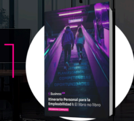
Libro físico accionable

No es un libro. No es una plataforma. Son tus clases enamorando a tu alumnado.